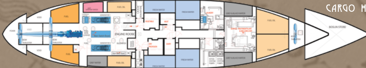
CARGO HOLD DECK